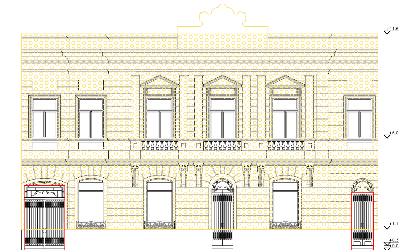
FACHADA ESC: 1:125

NOTA: TODAS LAS MEDIDAS DEBERAN SER VERIFICADAS EN OBRA. VER CONDICIONES PLIEGO DE ESPECIFICACIONES TECNICAS PARTICULARES.